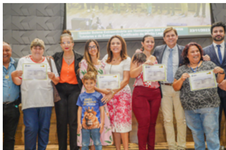
Solenidade em homenagem a conselheiros tutelares na Assembleia Legislativa

Os conselheiros são eleitos de quatro em quatro anos pelo voto popular, com possibilidade