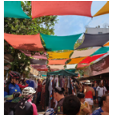
Junto e misturado: barato é adquirir peças boas e charmosas a um preço camarada