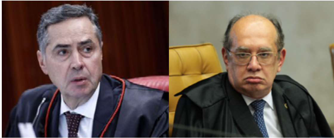
Ministro Luis Roberto Barroso

“Nada sugere que os problemas prioritários do Brasil estejam no Supremo Tribunal Federal. Até porque as mudanças sugeridas já foram acudidas, em sua maior parte, por alterações recentes no próprio Regimento do Supremo”, seguiu.