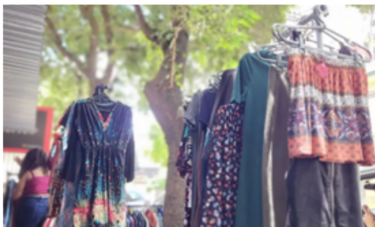
Atente-se às peças: evite zíper que não funciona, mancha de desodorante ou falta de botões

Além dos brechós a preços populares, existem aqueles responsáveis por comercializar peças de grife, muitas das quais integrantes da chamada alta costura. Aí muda tudo, a começar pelo valor salgado. Nesses ambientes, não raro, encontra-se quem abra a carteira para pagar R$ 58 mil por uma bolsa Chanel 2.55, fabri-