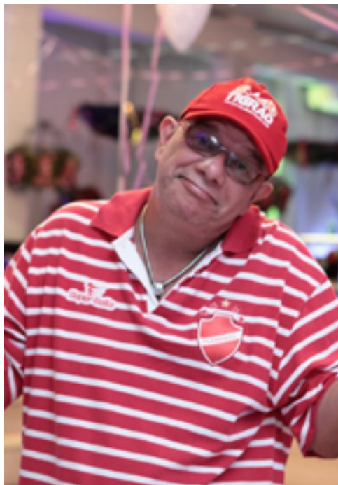
Xexéu, cantor: "sofremos, mas sempre estamos juntos, é uma paixão louca"