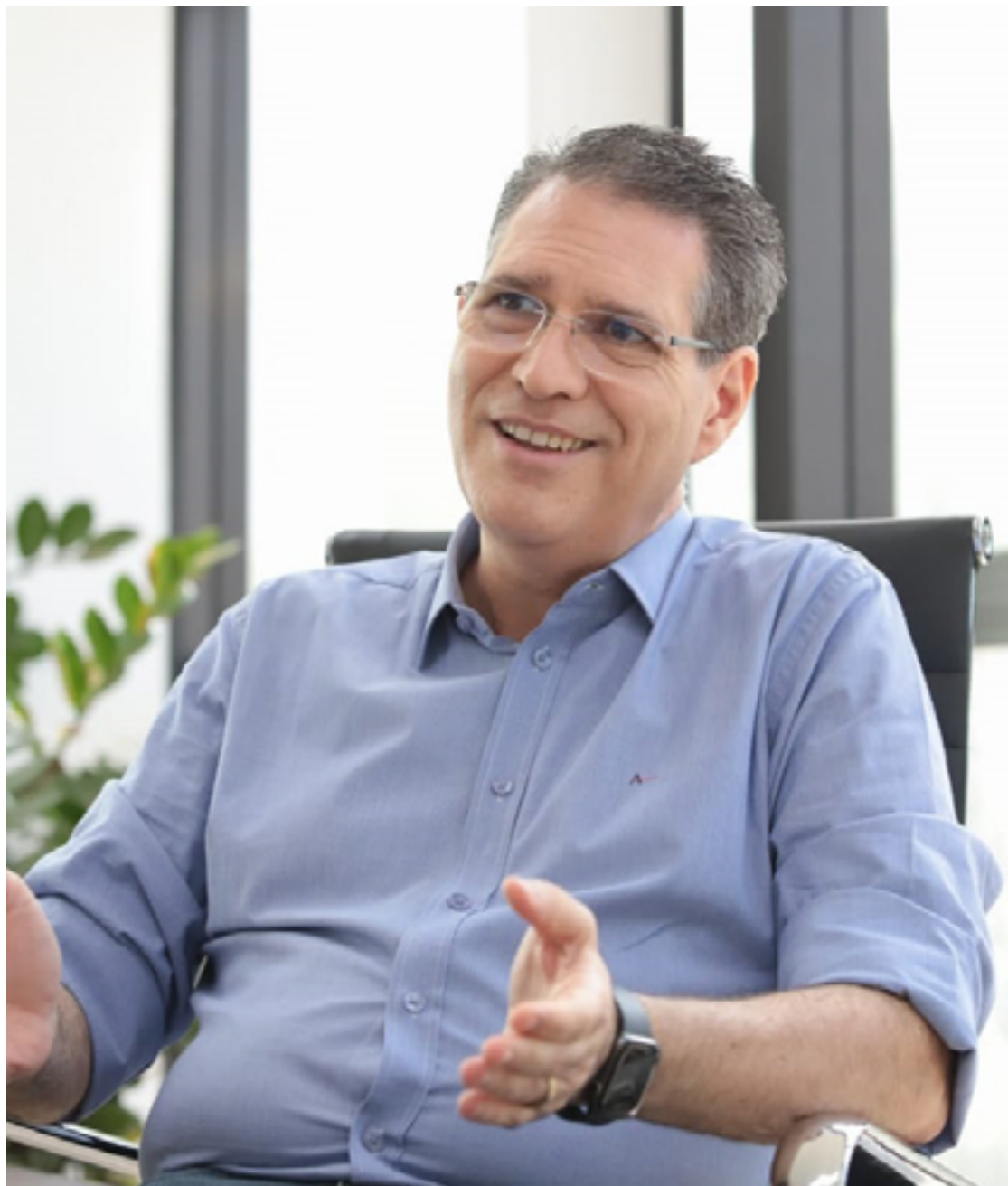
Francisco Jr: PSD contribuir com o crescimento do Estado com membros do Executivo e Legislativo

O ex-parlamentar acha “natural” que, em algum caso, haja divergência local, o que poderá fazer com que a base do gover-