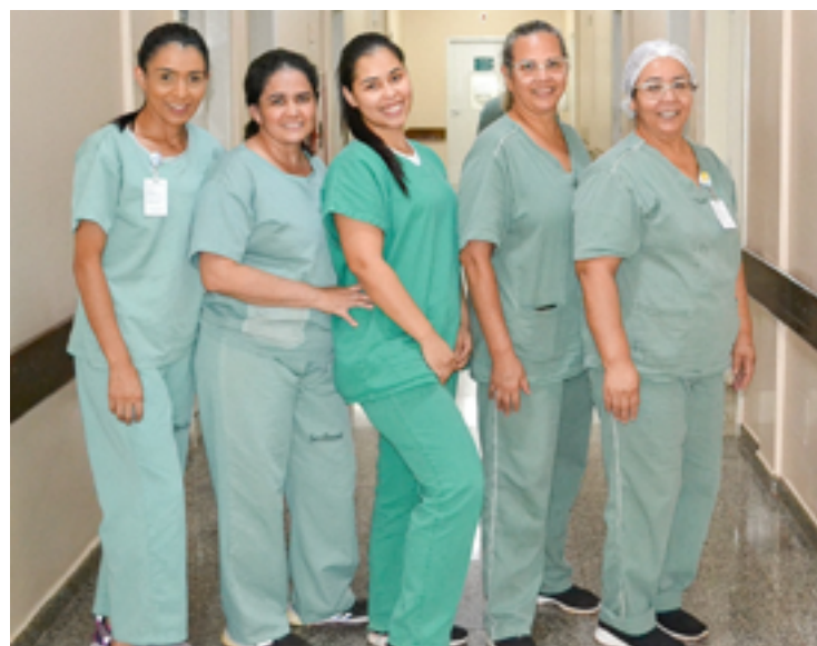
Hospital reforça seu comprometimento em valorizar os profissionais de enfermagem — Foto: Reprodução.

Além do mais, o Herso reforça a posição do IPGSE em administrar comprometida com a transparência, responsabilidade e valorização dos colaboradores. "Esses elementos são essenciais para o fortalecimento contínuo do hospital como uma instituição de referência na área da saúde", relata.