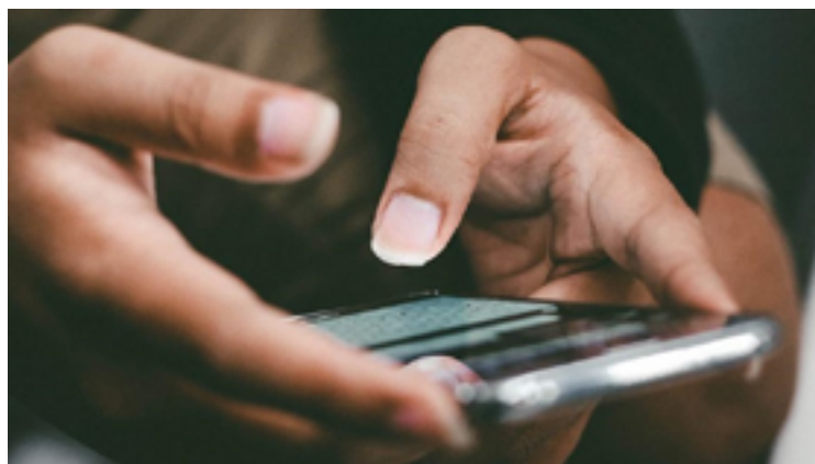
Menos de uma semana após o reestabelecimento dos serviços, os moradores de Jataí enfrentam novamente a falta de comunicação — Foto: Reprodução.

Inicialmente você tem que se cadastrar na opção “Ainda não sou cadastrado” e seguir