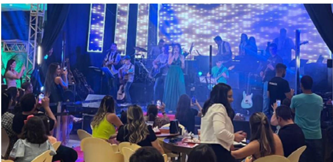
Show de Talentos: Evento reúne cantores, instrumentistas e grupos musicais