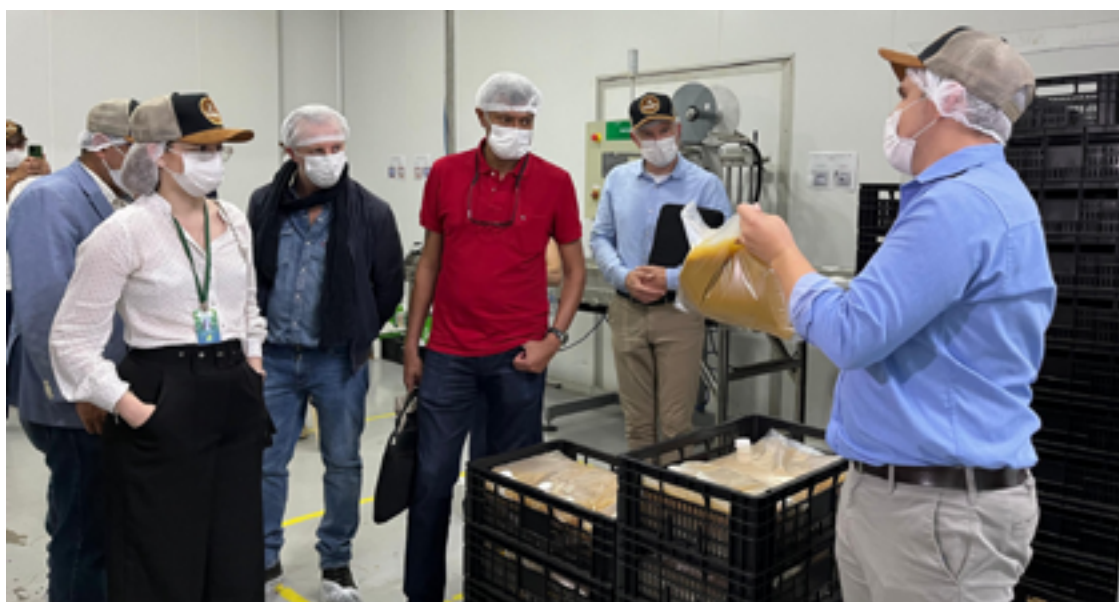
Representantes de 9 países e gestores da Seapa em visita à fábrica da Solubio em Jataí