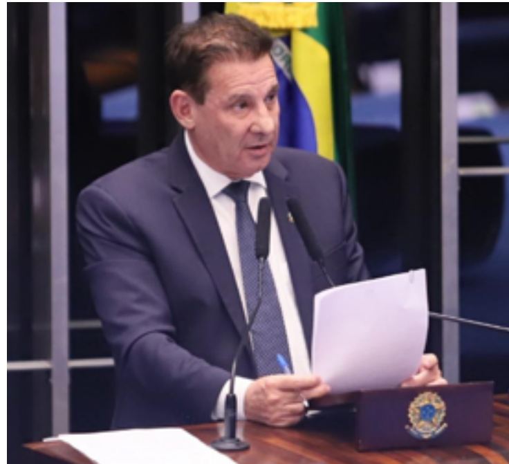
Vanderlan Cardoso: maior ação ao Banco Central