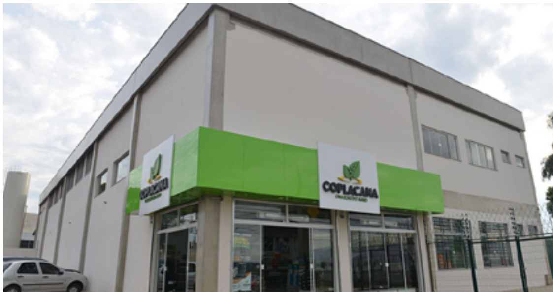
Unidade da Coplacana em SP. Em Quirinópolis, espaço contará com capacidade de armazenamento de 1 milhão e 200 mil sacas