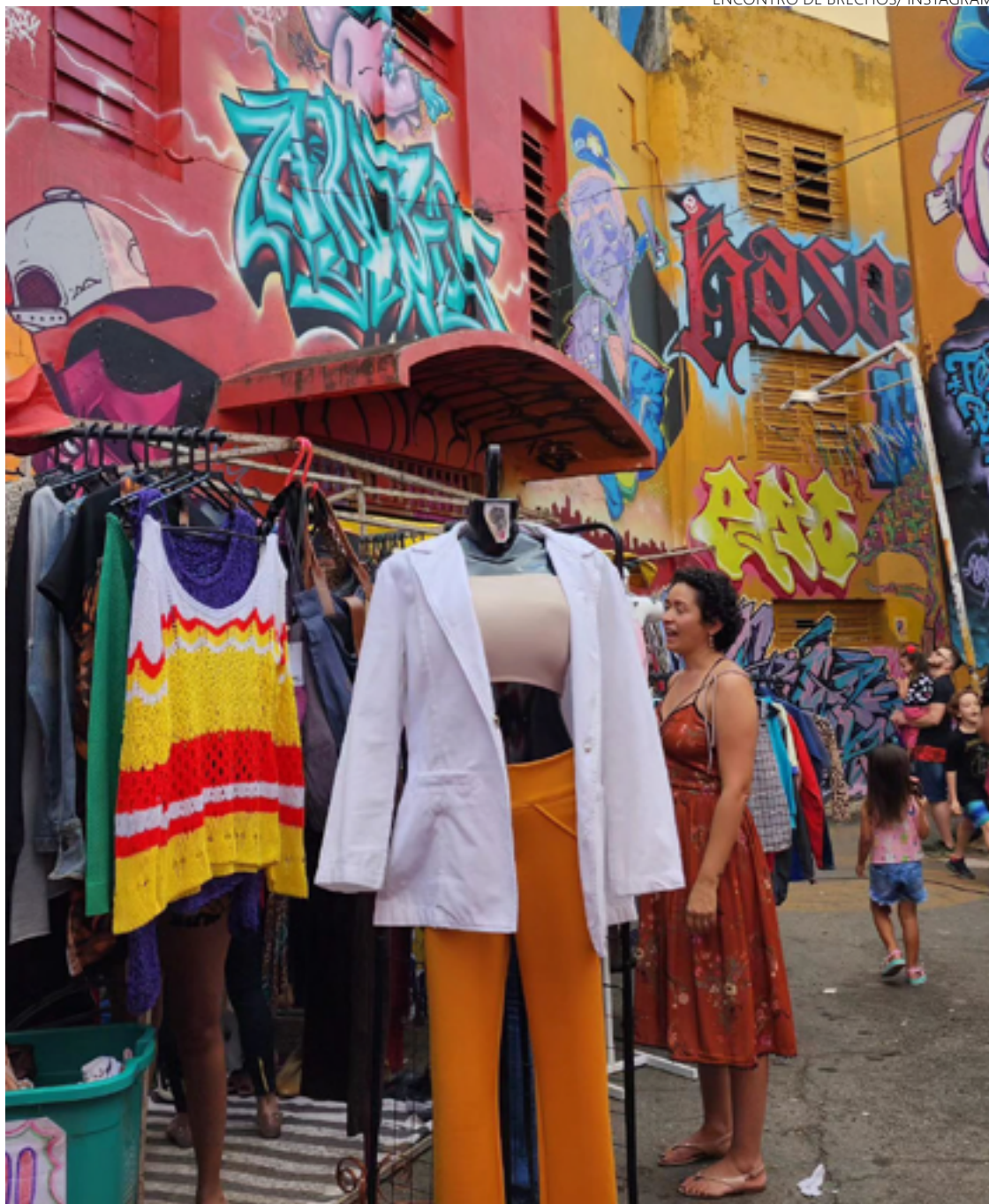
Socialização: brechós se constituem momento em que as pessoas conversam umas com as outras

“Tendo em vista a finitude dos recursos naturais e até