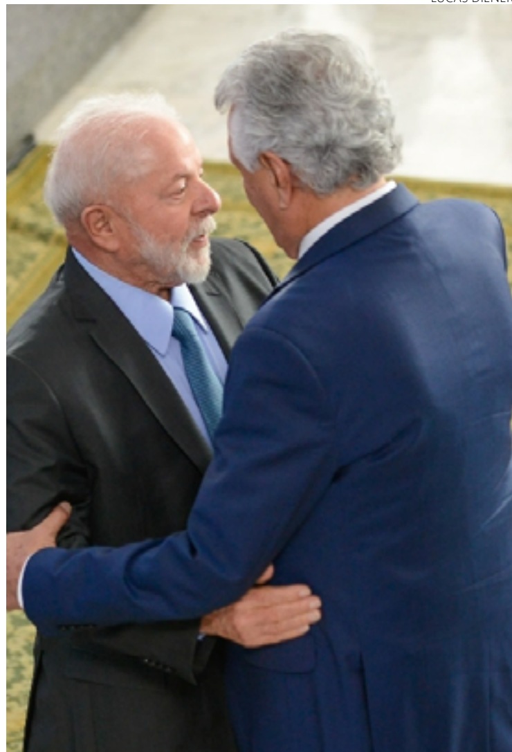
Abraço republicano: Ronaldo Caiado se encontra com Lula em Brasília. Gestor goiano reconhecido pelo viés de direita supera questões ideológicas e busca recursos no Governo Federal

Lula também falou da importância destes programas: "Ter uma casa é ter um ninho seu, é saber que não tem de procurar um galho a cada primavera, é não ter de correr a cada chuva, é ter um lugarzinho que é seu".