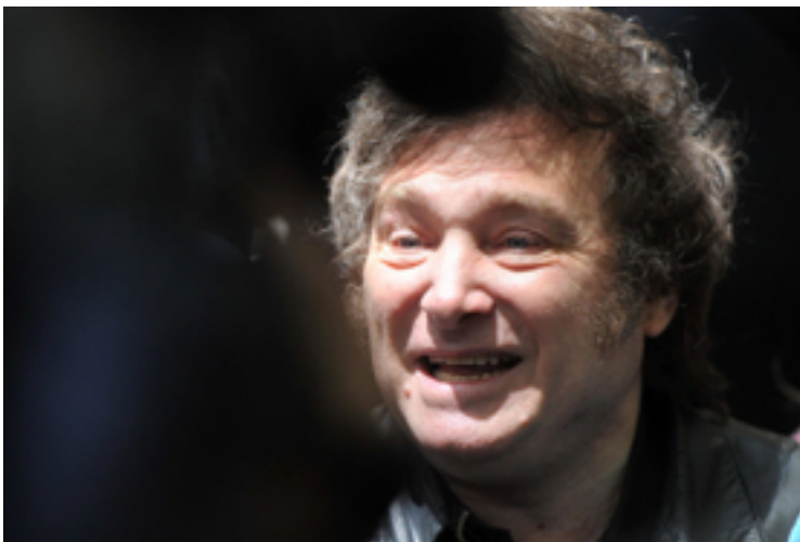
Javier Milei: convite a Lula para ir à posse